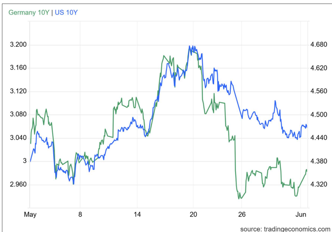
TIR del bono a 10 años del Tesoro americano vs TIR del bono alemán a 10 años.

Antes, el 11 de junio, será el turno del Banco Central Europeo, que también tendrá que valorar hasta qué punto las tensiones energéticas y geopolíticas están condicionando la evolución de los precios y el crecimiento económico y si, finalmente, decide implementar o no las primeras subidas de tipos de interés.