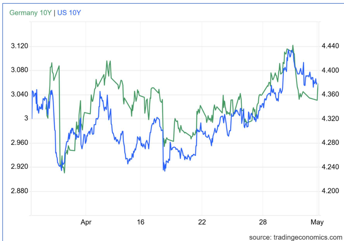
TIR del bono a 10 años del Tesoro americano vs TIR del bono alemán a 10 años.

además, por decisiones geopolíticas relevantes de la Administración estadounidense, como la retirada de tropas de Alemania o el endurecimiento de los aranceles sobre automóviles europeos (25%).