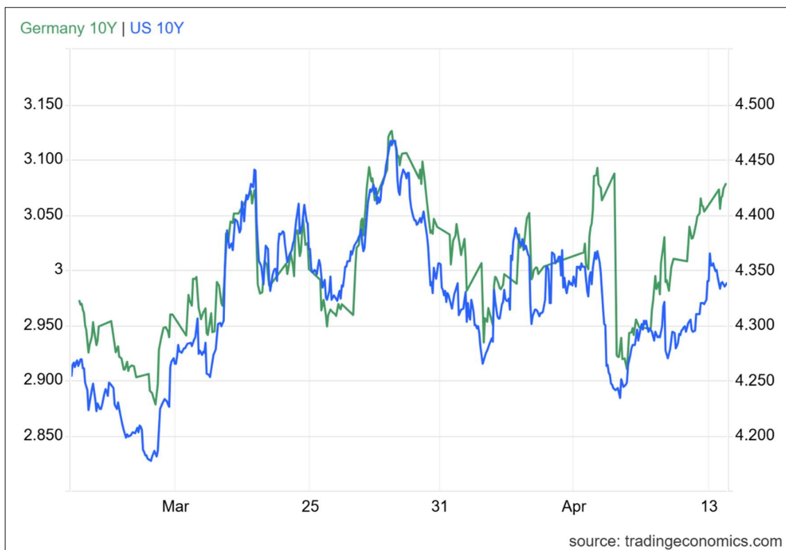
TIR del bono a 10 años del Tesoro americano vs TIR del bono alemán a 10 años.

El movimiento más significativo se produjo en la sesión del 8 de abril – coincidiendo con el inicio de la tregua –, cuando las rentabilidades de la deuda registraron una abrupta caída. En Estados Unidos, la TIR del bono a 10 años descendió con fuerza por debajo del 4,3%, mientras que en la eurozona el rendimiento del Bund alemán a 10 años perforó el nivel del 3%. Sin embargo, este movimiento fue transitorio. A medida que el mercado fue reevaluando el alcance real de la tregua, las rentabilidades fueron repuntando progresivamente hasta situarse nuevamente en niveles similares a los previos.