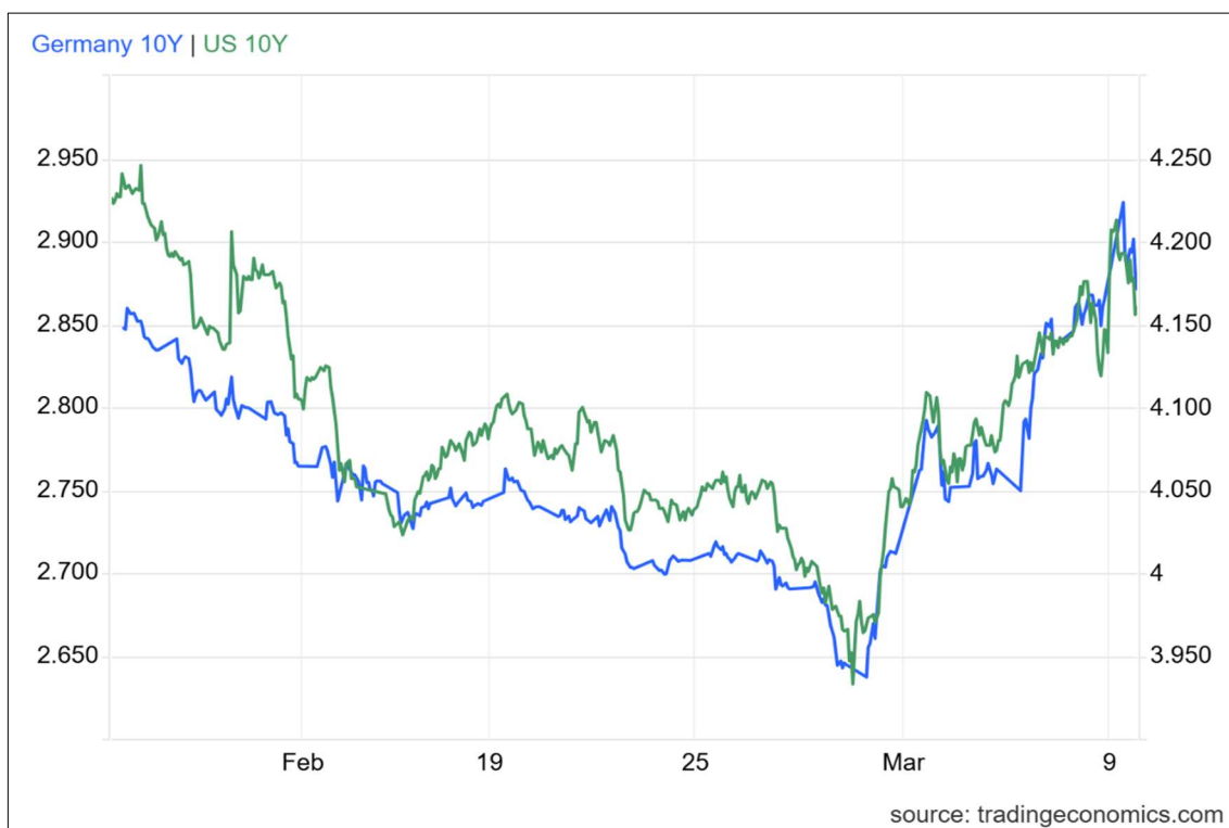
TIR del bono a 10 años del Tesoro americano vs TIR del bono alemán a 10 años.

El resto de mercados bursátiles también se vieron contagiados por la incertidumbre del momento, con fuertes caídas tanto en las bolsas emergentes como en la japonesa. No hay que olvidar que Asia y Japón son dos de las áreas más afectadas por el estallido del conflicto en Irán, debido a su dependencia energética. No en vano, Japón importa más del 90% de su petróleo a través del Estrecho de Ormuz, mientras que China importa el 40% de su petróleo y el 30% de su gas natural licuado (GNL) a través de este estrecho.