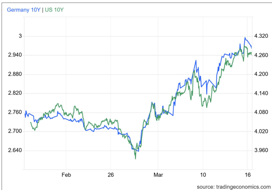
TIR del bono a 10 años del Tesoro americano vs TIR del bono alemán a 10 años.

Con todo, el mercado de renta fija ha sido uno de los segmentos donde las tensiones geopolíticas actuales se han reflejado con mayor intensidad. El temor a un posible repunte inflacionista y la incertidumbre en torno a las políticas monetarias han provocado un aumento significativo en las rentabilidades de la deuda soberana.