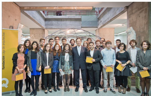
Ceremonia de entrega de becas en Escuela Superior de Arquitectura de Valladolid

La ceremonia de entrega de becas, tuvo lugar el día 25 de octubre en la escuela Superior de Arquitectura de Valladolid. El acto contó con la intervención del arquitecto Alberto Campo Baeza quien además, realizó el avance de la presentación del tema "Construir un sueño" para el Concurso correspondiente a la edición Becas 2014.