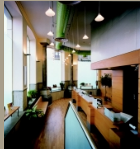
Granada Arquitecto: José Garzón Vicente