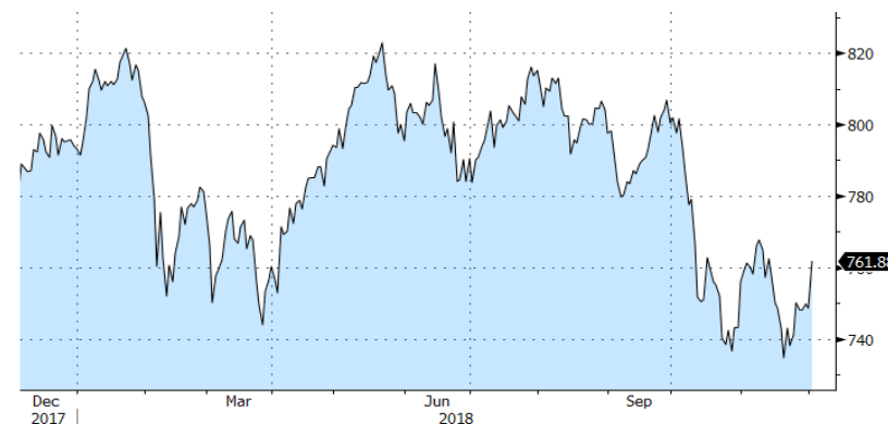
STOXX EUROPE 600 PRICE INDEX - 1 Y

En definitiva, esta semana se han dado dos catalizadores que podrían dar un gran impulso a los mercados de renta variable a nivel global. Quedamos ahora a expensas de que se resuelva el conflicto italiano y que el Parlamento Británico apruebe el acuerdo del Brexit .