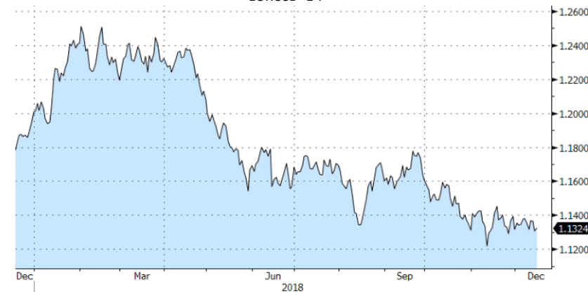
EURUSD - 1 Y

De cara a esta semana el principal acontecimiento a tener en consideración es la reunión de la Fed, en la que ya está descontado que llevarán a cabo una subida de tipos.