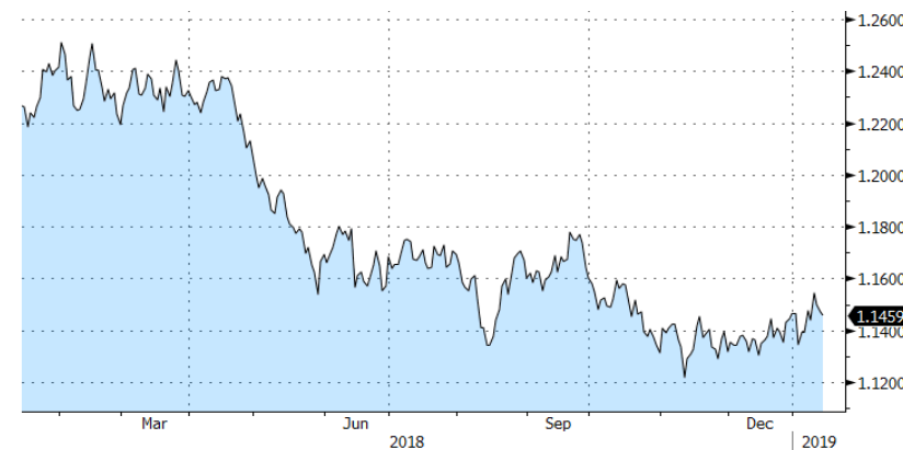
EURUSD - 1 Y

En cuanto al mercado de deuda, la pasada fue una semana muy activa en primarios. Irlanda y Portugal emitieron por 4.000 millones cada una, así como muchas empresas han aprovechado el inicio de año para lanzar emisiones a mercado.