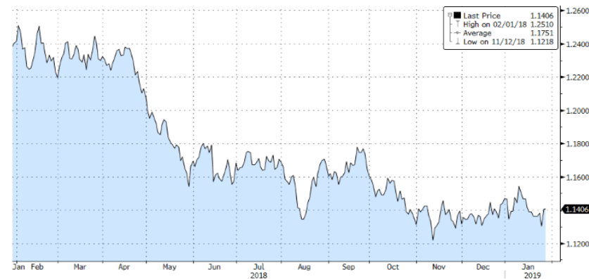
EURUSD- 1 Y

En relación a la renta variable, a nivel sectorial destacamos el buen comportamiento de las compañías tecnológicas lideradas por Stmi electronics. Estaremos especialmente atentos a la temporada de publicación de resultados correspondiente al cuarto trimestre.