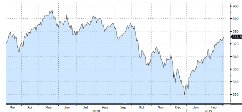
STOXX EUROPE 600 - 1Y

Las bolsas europeas cierran la semana también con avances, tras las expectativas positivas de un acuerdo comercial. A nivel nacional el Ibex cierra la semana y el mes de febrero por encima de los 9.300 puntos, ante una semana clave de resultados empresariales. El sector bancario destaca como gran protagonista con subidas medias superiores al 3%, mientras el mercado golpea fuertemente sobre IAG tras conocerse que ha dejado de pertenecer al índice MSCI Spain.