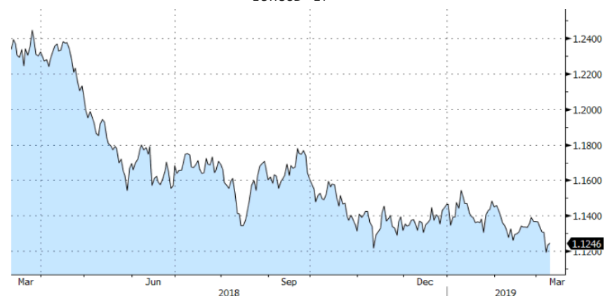
EURUSD - 1Y

A nivel nacional, el Ibex35 cierra la semana en números rojos con una fuerte caída del sector bancario. Contrariamente, el sector eléctrico resultó favorecido por menores costes de la deuda.