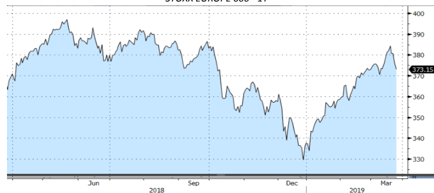
STOXX EUROPE 600 - 1Y

El Ibex cierra la semana en positivo, con avances del 0,7% y los rumores de una posible fusión entre Banco Sabadell y Bankia, lo que no ha impedido que ambos valores cierren la semana con números rojos.