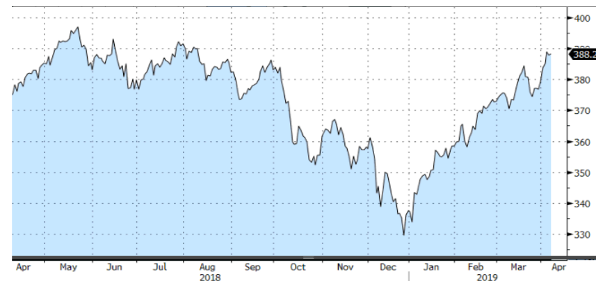
STOXX EUROPE 600 - 1Y

En cuanto al ámbito sectorial, avances generalizados destacando la industria básica y la banca, con ganancias superiores al 5%. Destacar también la industria automotriz con avances superiores al 7% impulsado por la suspensión de los aranceles sobre los vehículos por parte de China.