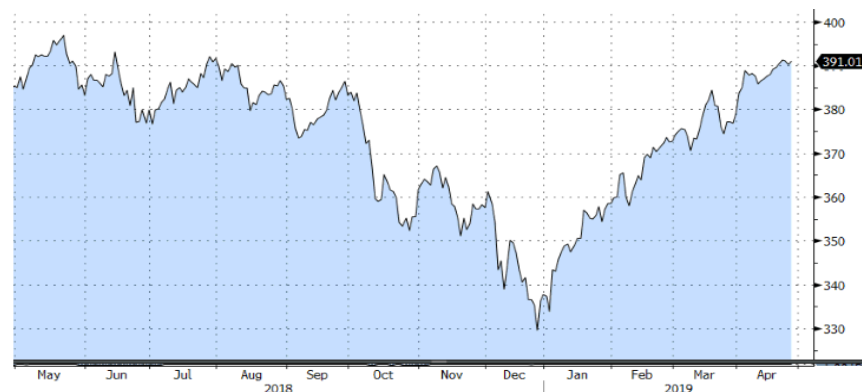
STOXX EUROPE 600 - 1Y

A nivel sectorial, los bancos y la industria básica eran los que registraban el peor comportamiento de la semana, mientras que la tecnología y el consumo básico tuvieron el mejor comportamiento.