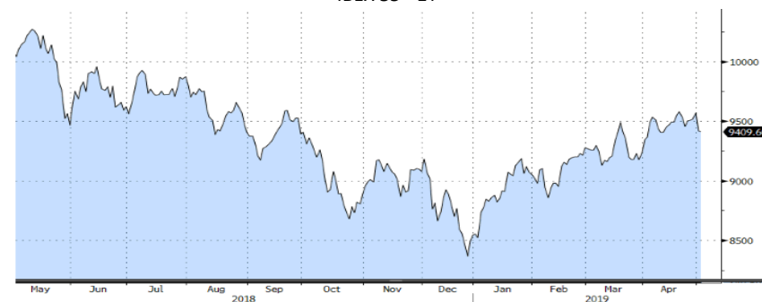
IBEX 35 - 1Y

A nivel sectorial, casi todos los sectores cerraron la semana en negativo, destacando positivamente el sector salud y el bancario, mientras que el sector industrial presentó el peor comportamiento de la semana.