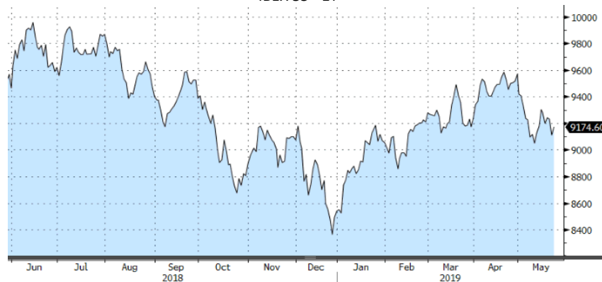
IBEX 35 - 1Y

A nivel sectorial, la mayoría cerraron la semana en negativo, con excepción de los más defensivos como utilities , telecos o la salud. Los peores comportamientos lo anotaron los sectores más cíclicos como los autos, la banca o el retail .