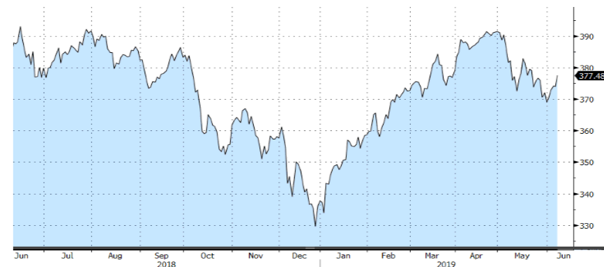
STOXX EUROPE 600 - 1Y

Ganancias generalizadas para todos los sectores, destacando el buen comportamiento de las químicas y utilities . La banca presentó el peor comportamiento de la semana, penalizada por las laxas y continuas políticas monetarias.