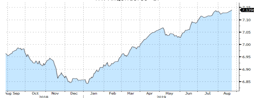
FAV ARQUITECTOS - 1Y

A nivel macroeconómico, mencionar que los PMI's estadounidenses de agosto no convencían a los inversores, con el manufacturero entrando en zona de contracción por primera vez en 10 años. En los mercados de deuda, destacar que la primera subasta del 30 años alemán, con tipo negativo, no consiguió los objetivos establecidos de colocación.