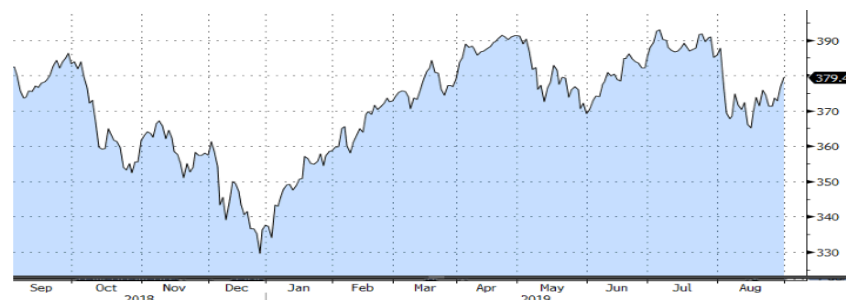
STOXX EUROPE 600 - 1Y

El colapso de las exportaciones empujaba a la principal economía del Viejo Continente a situarse al borde de la recesión, mostrando una contracción del -0,1% en el 2T del 2019, nueva señal del grave impacto de la guerra comercial.